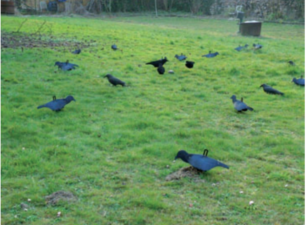
Ein „freundliches“ Lockbild.