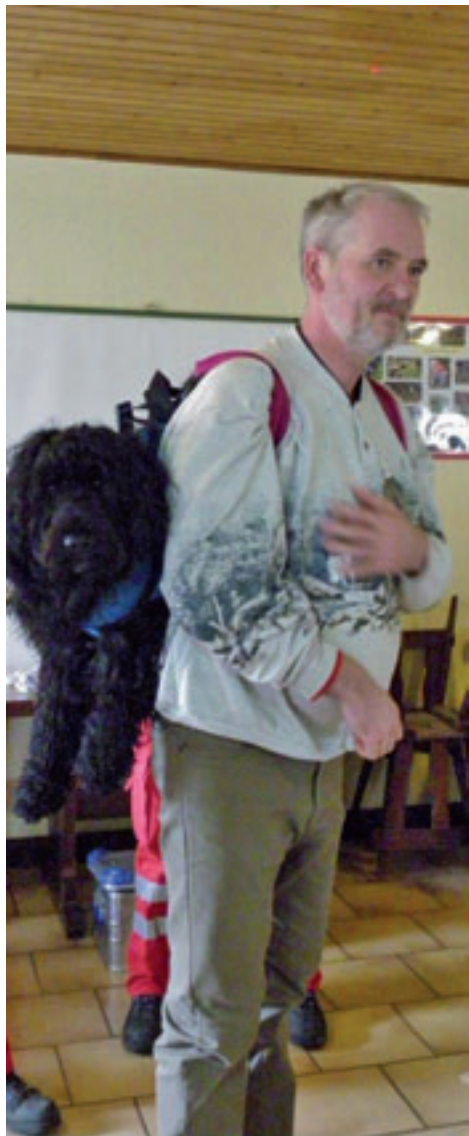
Wenn nichts mehr geht ...

Tagesseminar im Vereinsheim des Hundesportverein Ueberau