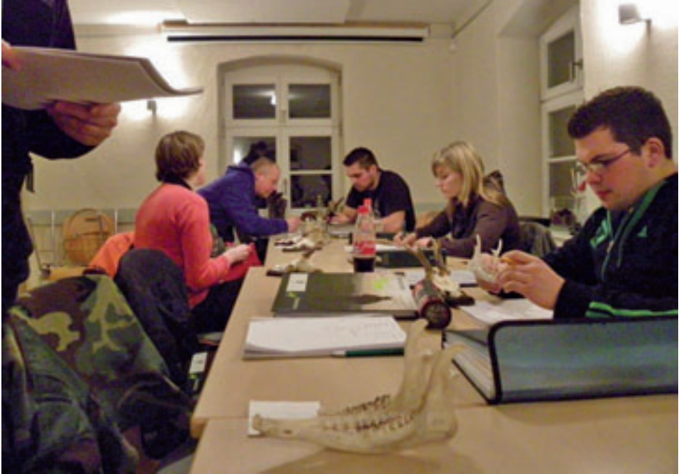
Rauchende Köpfe ...