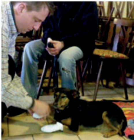
Versorgung von Pfotenverletzungen

Wie man einen verletzten Hund richtig trägt oder legt, Verbände anlegt, bei Verdacht auf Vergiftungen, Hitzschlag u.s.w. reagieren soll, war für die Teilnehmer nach einem gelungenen Seminartag keine Frage mehr.