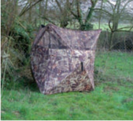
Tarnung ist alles.

Und auch bei der persönlichen Tarnung sowie der Tarnung des Schirmes darf nichts dem Zufall überlassen werden. Um die Krähen auf Schrotschussentfernung an den Schirm zu locken, ist ein „freundliches Lockbild“ erforderlich. Ein Lockbild, das die Krähen bei der Nahrungsaufnahme imitiert. Mindestens zehn bis zwanzig beflockte Attrappen, die „zufällig“ aufgestellt werden, bieten beste Voraussetzungen. Mit Hilfe eines Krähenlockers - vorgeführt wurde der „Rottumtaler Krähenlocker“ - kann die Strecke noch verbessert werden.